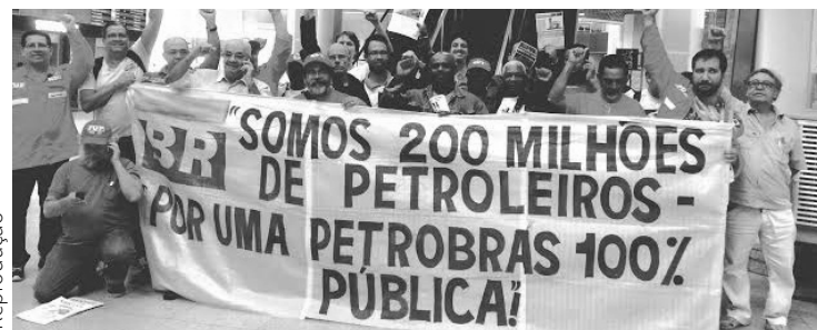
“PARA SER NOSSO” Nacionalizar o petróleo e reestatizar a Petrobras: passos fundamentais para o País

O povo brasileiro tem o direito de decidir soberanamente sobre a exploração de seus recursos naturais. A nacionalização do petróleo e a reestatização da Petrobras são passos fundamentais para garantir que a riqueza gerada pelo petróleo beneficie diretamente a população, promovendo um desenvolvimento econômico que respeite o meio ambiente ao mesmo tempo que melhora as condições de vida de todos os brasileiros.