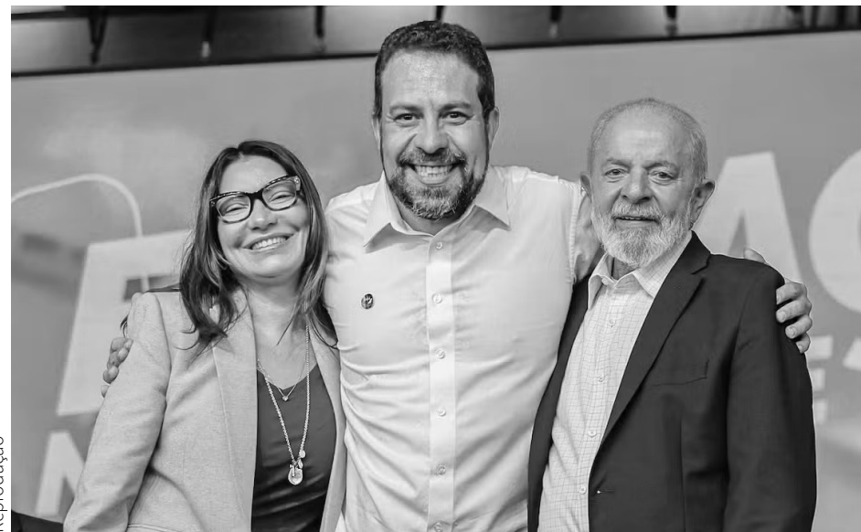
REALIDADE Política identitária do PSOL, de Boulos, e de Janja, fazem de Lula um “super esquerdista”