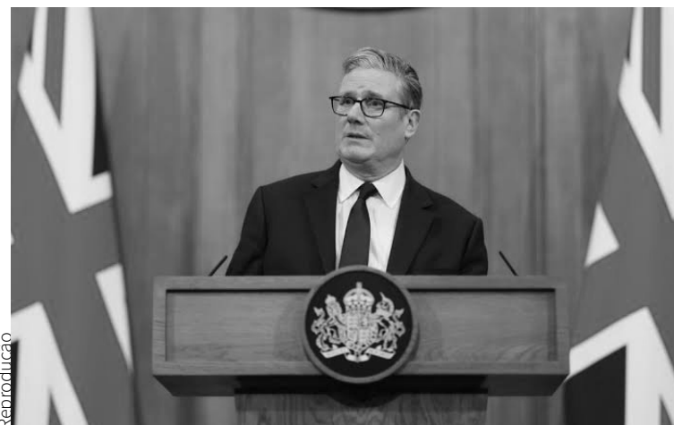
ALIADO DO SIONISMO Depois de apoiar o genocida Netanyahu e atacar trabalhadores Starmer anunciou renúncia

A queda de Starmer é não somente mais um sinal da decomposição do regime político britânico, mas a expressão, em um dos países imperialistas mais importantes, da crise de conjunto do capitalismo mundial, que atinge, indistintamente, todas as maiores economias e os regimes políticos imperialistas ao redor do mundo.