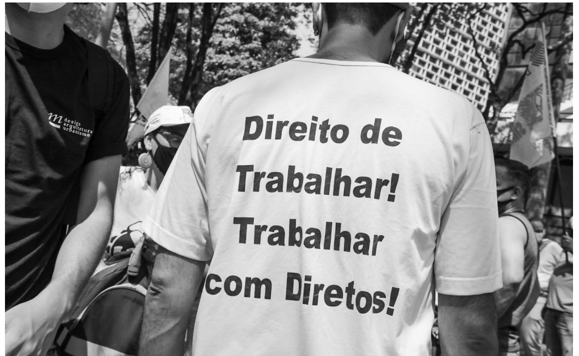
SEM DIREITOS Brasil tem até 13 milhões de “pejotizados” e mais de 50% dos MEIs são empregados disfarçados

Somente uma ampla mobilização da classe trabalhadora poderá dar um basta à política da burguesia de destruição dos direitos.