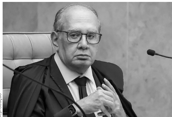
POLÍTICO Mesmo sem o voto popular, ministro atua politicamente em defesa da política neoliberal

O texto da súmula segue para julgamento no STF. Coisa boa não sairá destes “defensores da democracia”.