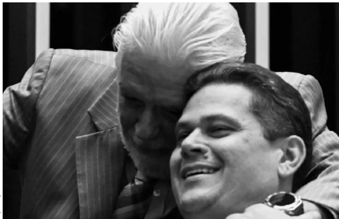
DIREITISTA Ser representante da ala mais à reacionária do PT e sionista não vai livrar Wagner dos ataques

enfraquecer os principais candidatos quanto para preparar o caminho para uma possível terceira via. Enquanto isso, a esquerda enfrenta o desafio de se posicionar diante de um cenário político cada vez mais complexo e polarizado.